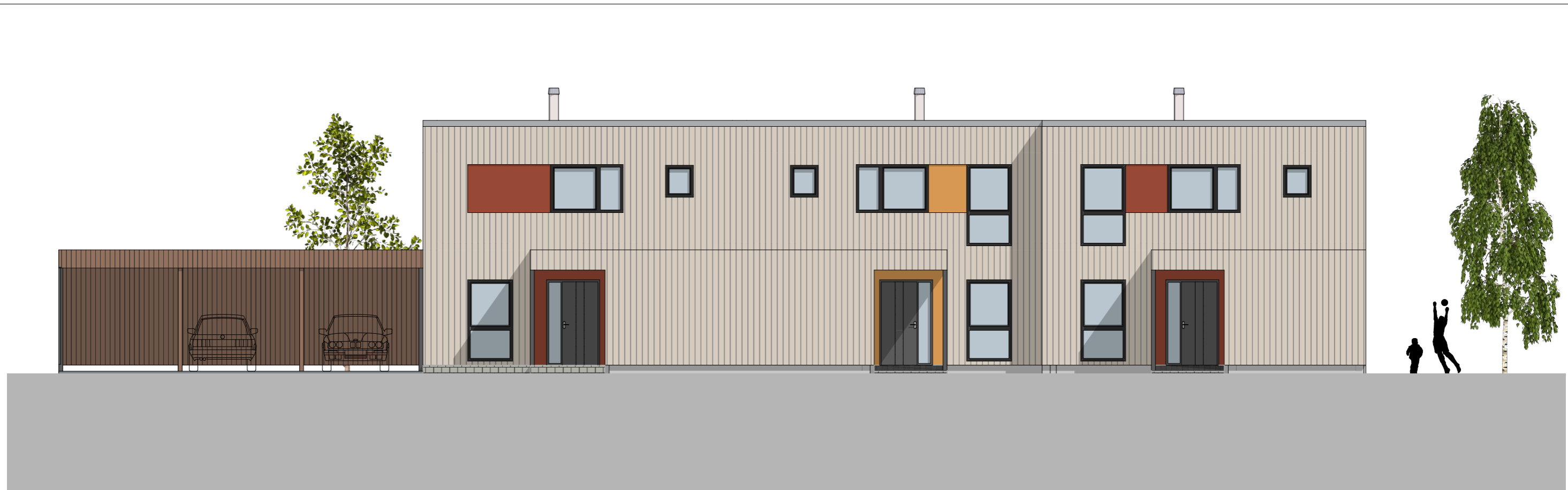
1:100 Fasade Nord