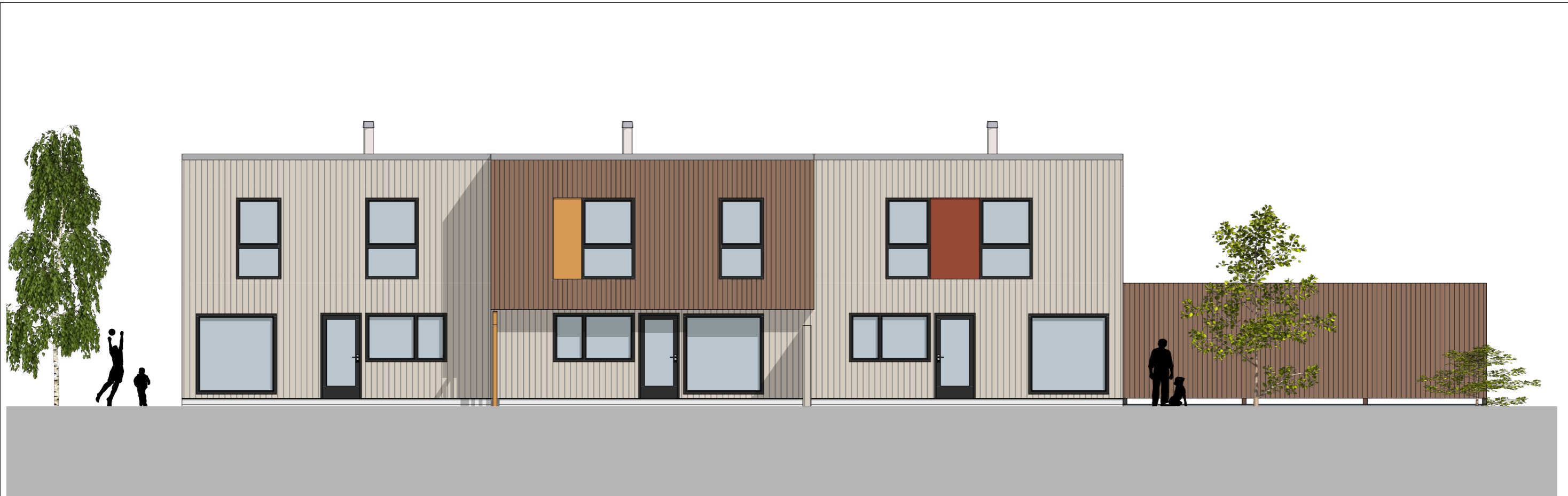
1:100 Fasade Sør