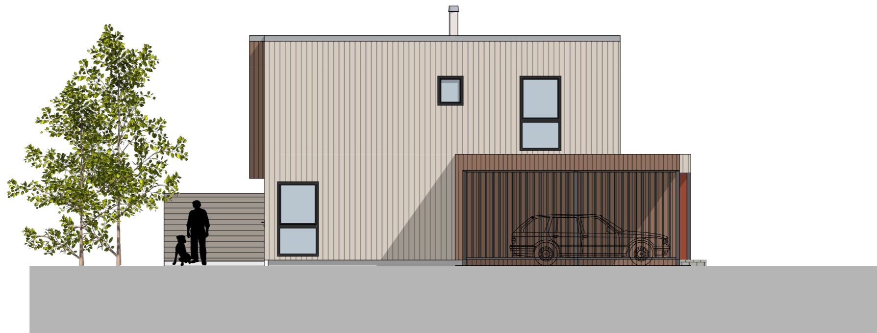
1:100 Fasade Øst