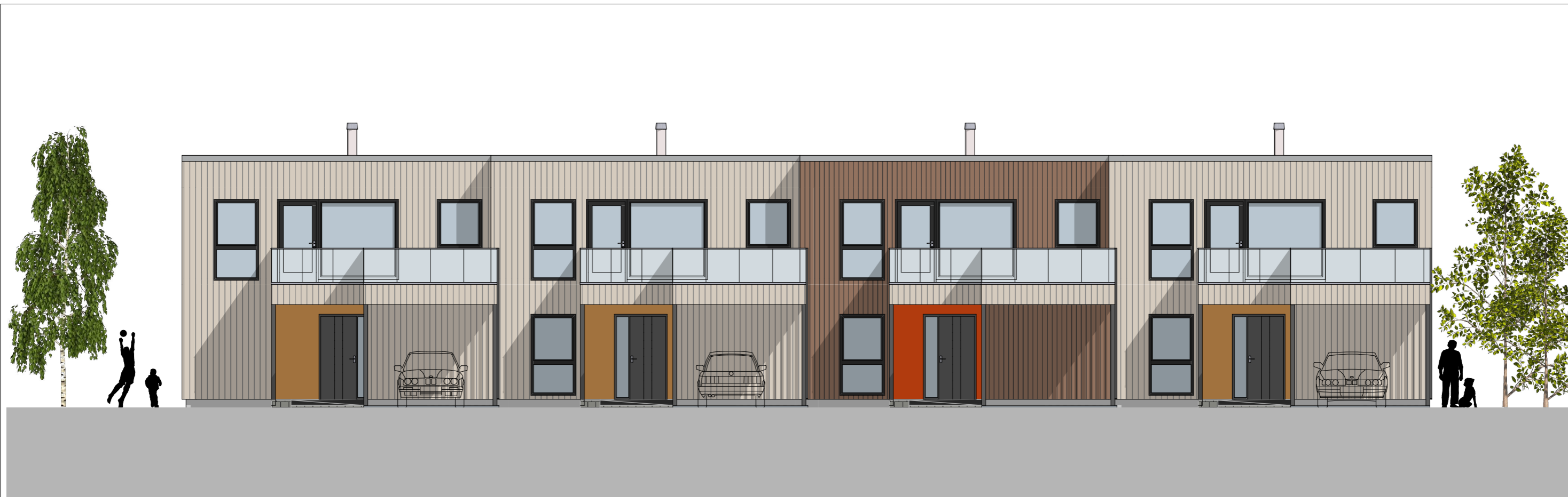
1:100 Fasade Sør