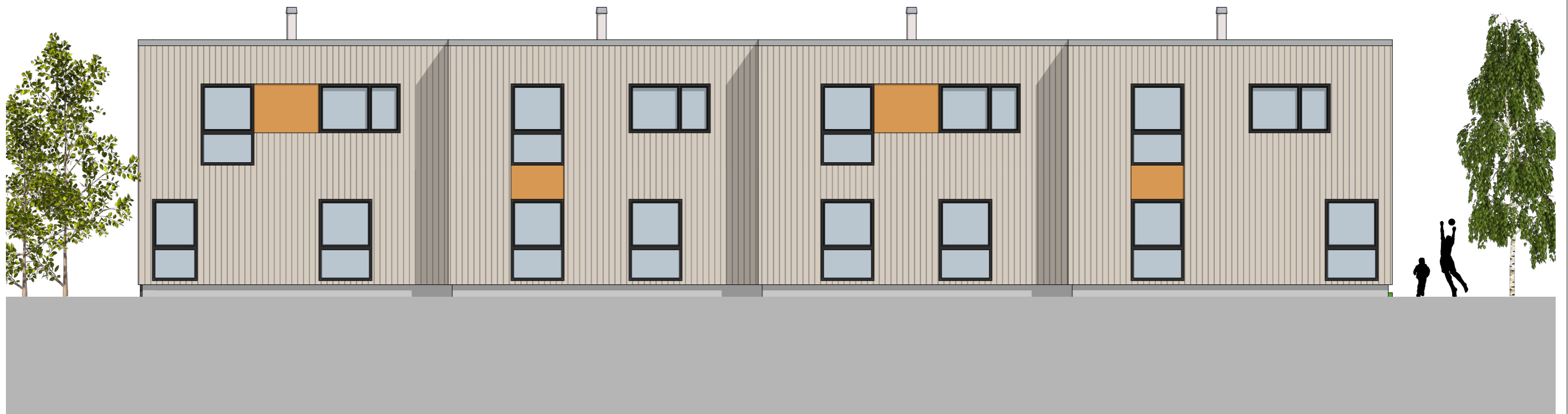
1:100 Fasade Nord