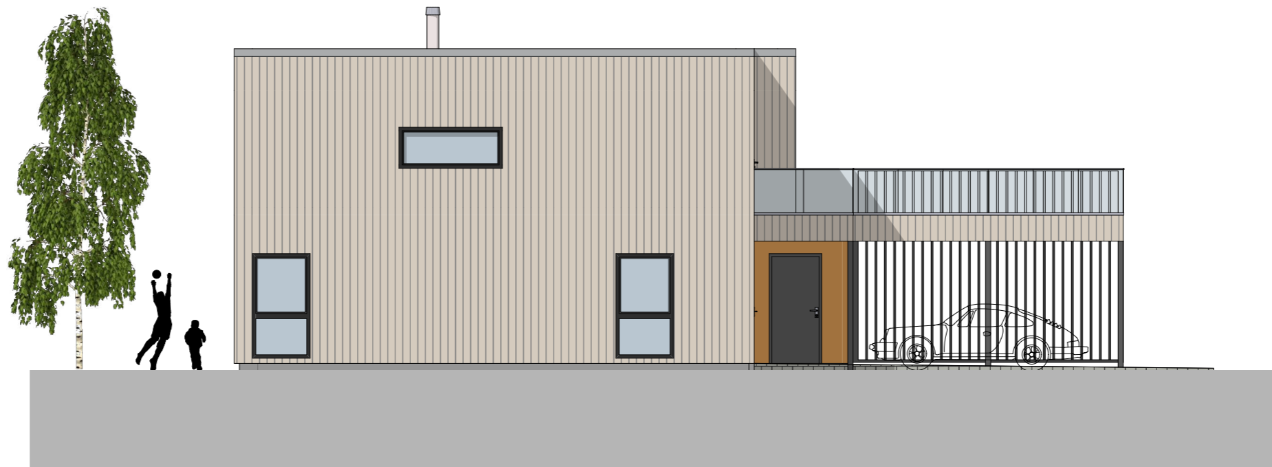
1:100 Fasade Vest