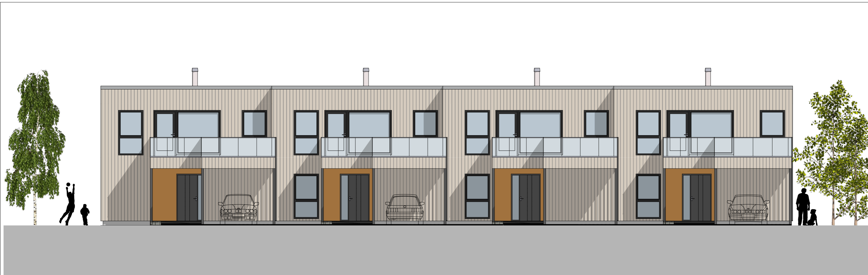
1:100 Fasade Sør