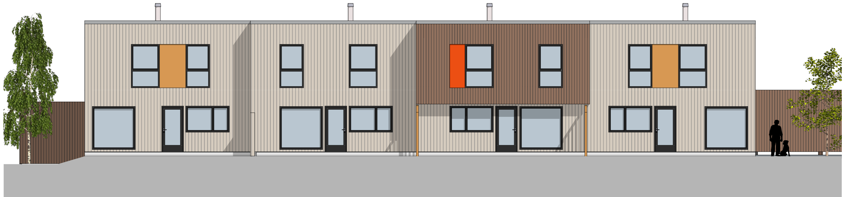
1:100 Fasade Sør