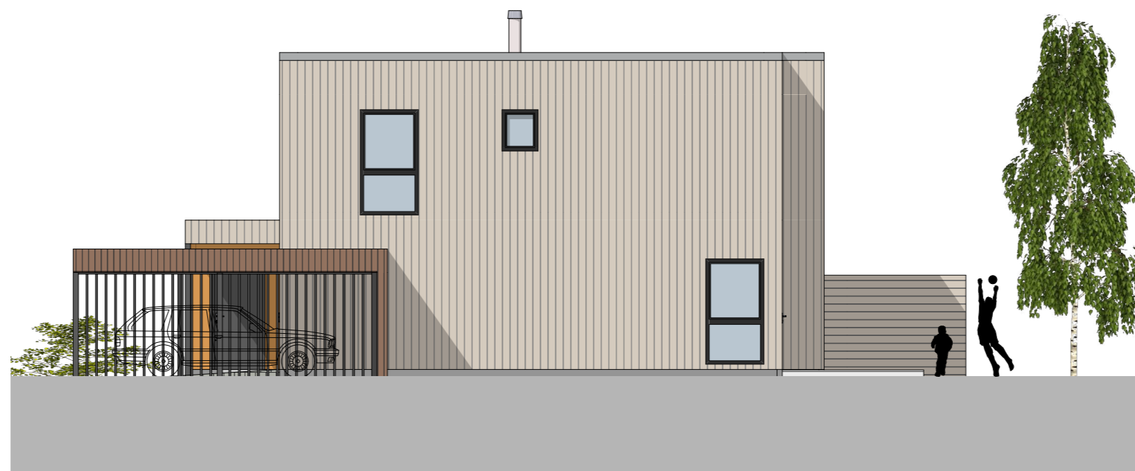
1:100 Fasade Vest