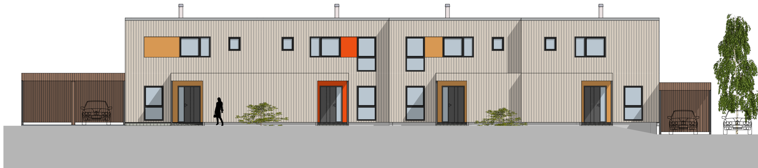
1:125 Fasade Nord